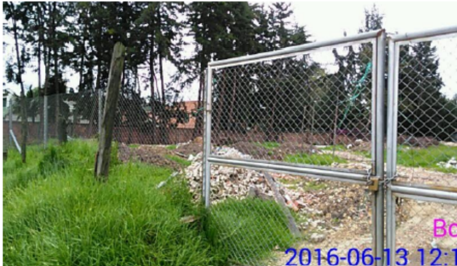
Fotografía 3. Se puede observar la disposición de RCD mezclados en el predio sin las medidas de manejo ambiental.