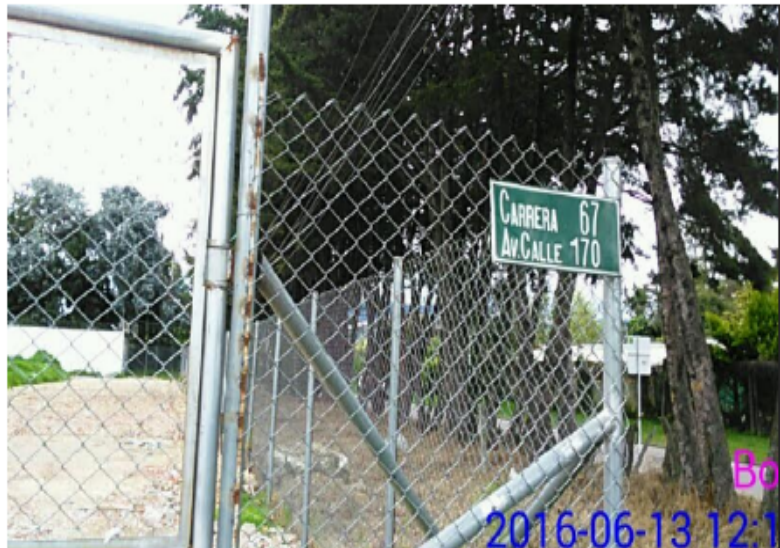
Fotografía No 1: Se observa la nomenclatura más cercana al predio en mención.