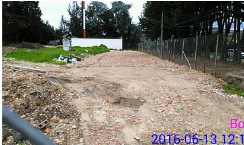
Fotografía No 2: Se observa la disposición de RCD, los cuales están siendo utilizados para la nivelación del terreno.

Durante la visita técnica realiza el día 13 de junio de 2016, se encontró un predio ubicado en la AC 170 67 28 del 23 el cual se encuentra con un cerramiento en malla eslabonada, sin embargo se puede determinar que en dicho lugar, se están realizando actividades de disposición y nivelación del terreno con escombros o Residuos de Construcción y Demolición (RCD) sin las medidas de manejo ambiental y permisos de la autoridad ambiental.